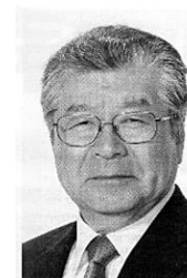
日本共産党新潟市議会議員